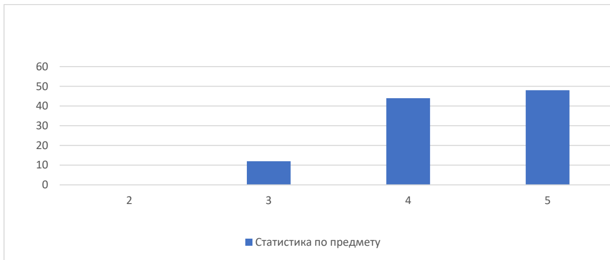
Рисунок 1 Статистика по отметкам

Вывод: В Таблице 2 и гистограмме дан процент отметок по истории в 11-х классах по ГБОУ Гимназии №49, по Приморскому району, по Санкт-Петербургу. Учащиеся ГБОУ Гимназии №49 двоек не получили, троек меньше на 12,57%, в сравнении со средним % по Приморскому району. Учащиеся ГБОУ Гимназии № 49 получили пятерок больше на 19,96 %.